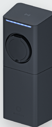
ENELION LUMINA SOCKET