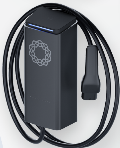
ENELION LUMINA CABLE PREMIUM